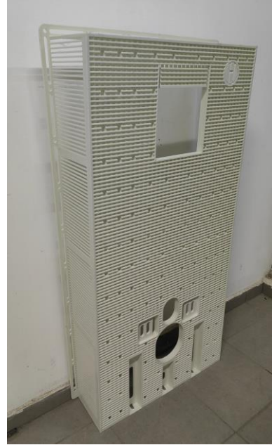
זיפויי מכל ההדוזה