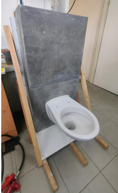
מכלל שהתקבל לבדיקה